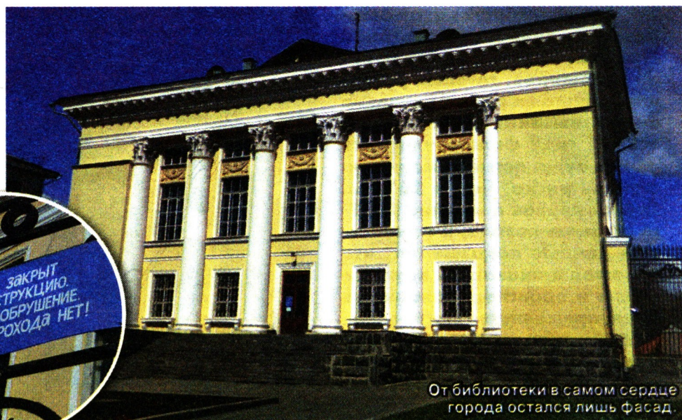
От библиотеки в самом сердце города остался лишь фасад.

Не так давно, в те времена, когда телевидение и Интернет еще не успели завладеть умами и свободным временем людей, самым распространенным развлечением молодых и стариков было чтение. Именно оно дарило нам возможность погрузиться в совершенно иной мир и узнать что-то новое. В каждом доме обязательно был шкаф, заполненный книгами сверху донизу. Сегодня это место уже не так популярно, как раньше. Почему? Сохранение библиотечных фондов – реальная проблема современного общества, поскольку именно от ее решения зависит сохранение и передача тех знаний, которые передавались от поколения к поколению многие сотни лет. Трудность состоит даже не столько в уменьшении востребованности библиотек из-за их замещения, но еще и в том, что эта отрасль перестала развиваться: фонды библиотек устарели, стали ограниченными и непривлекательными для сегодняшнего потребителя. А самая большая и старейшая библиотека Удмуртии – Национальная библиотека УР и вовсе вынуждена квартировать по подвалам, где беспощадно уничтожаются редчайшие экземпляры, гибнет классика.