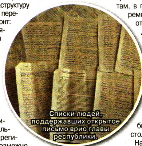
Списки людей, поддержавших открытое письмо врио главы республики.