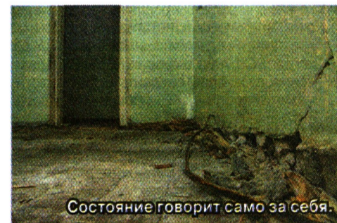
Состояние говорит само за себя.

встреч и общения с деятелями российской и мировой культуры. Например, Национальная библиотека им. А.С. Пушкина Республики Мордовия занимает 1300 кв. метров, имеет современную инфраструктуру и в ближайшие годы пережила серьёзный ремонт: он длился... три месяца! При этом фонды за пределы библиотеки не вывозили, делая ремонт здания частями.