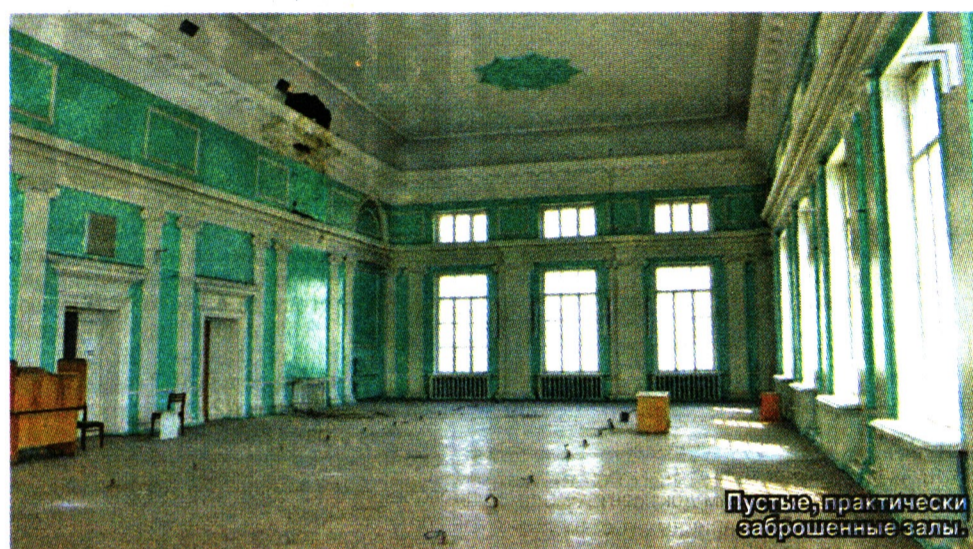
Пустые, практически заброшенные залы.